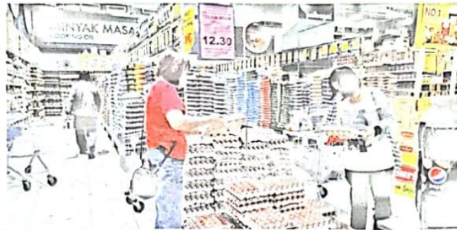
BEBERAPA pelanggan memilih untuk membeli telur ayam tempatan berbanding telur import (kiri) yang dijual di sebuah pasar raya di Lembah Klang semalam.

"Tambah pula, saya dapati telur import dari India bersaing agak kecil jika dibandingkan dengan telur gred C. Saya bimbang pelanggan tidak mahu beli," ka-