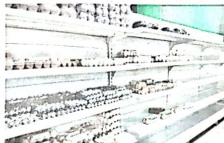
TELUR import masih belum boleh didapati di pasaran tempatan.

Dakwanya, ini kerana pihak pembekal telur ayam tempatan