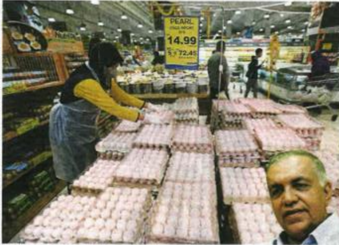
PEREKA menyusun telur import dari India yang mula dijual di pasaran, Garden Court, Ipoh.

"Pada pandangan saya, kerajaan tidak perlu men-