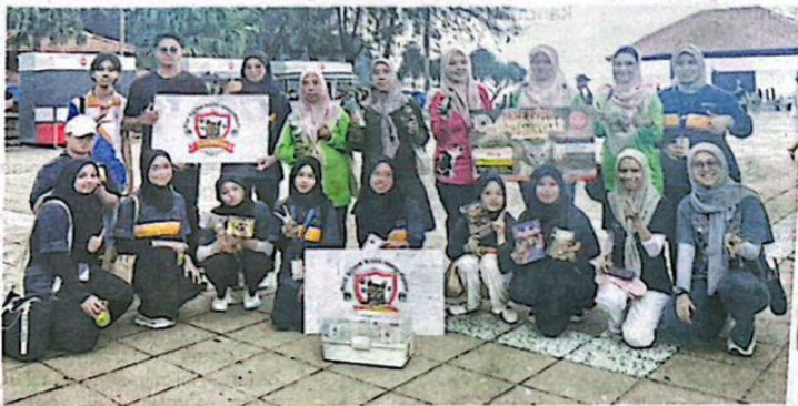
Ahli SKJP sentiasa berusaha mencari dana memastikan nasib haiwan jalanan terbelak.

Dia juga berharap kerajaan dan pihak NGO mengambil isu ini dengan serius.