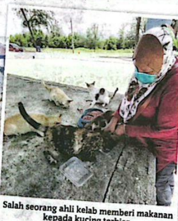
Salah seorang ahli kelab memberi makanan kepada kucing terbiar.